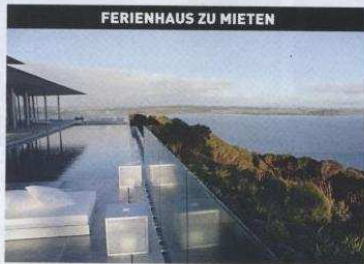
FERIENHAUS ZU MIETEN

Der spektakuläre Pool, dessen Himmelblau auf harmonischste Art mit der Bay of Islands, dem schönsten Platz auf der Nordinsel von Neuseeland, verschmilzt, ist nur eines von vielen Highlights dieses superluxuriösen Urlaubsdomizils aus poliertem Granit, leuchtendem Kupfer, Stahl und Milchglas. „Rahimoana Villa“ bezaubert maximal acht Gäste mit Spa, Heimkino, feinsten Küche, Champagner und besten Weinen ohne Limit sowie Porsche Cayenne mit Chauffeur. Der All-inclusive-Preis pro Nacht: 19 000 Euro, Tel. 0064/9/403 83 33, www.eaglesnest.co.nz